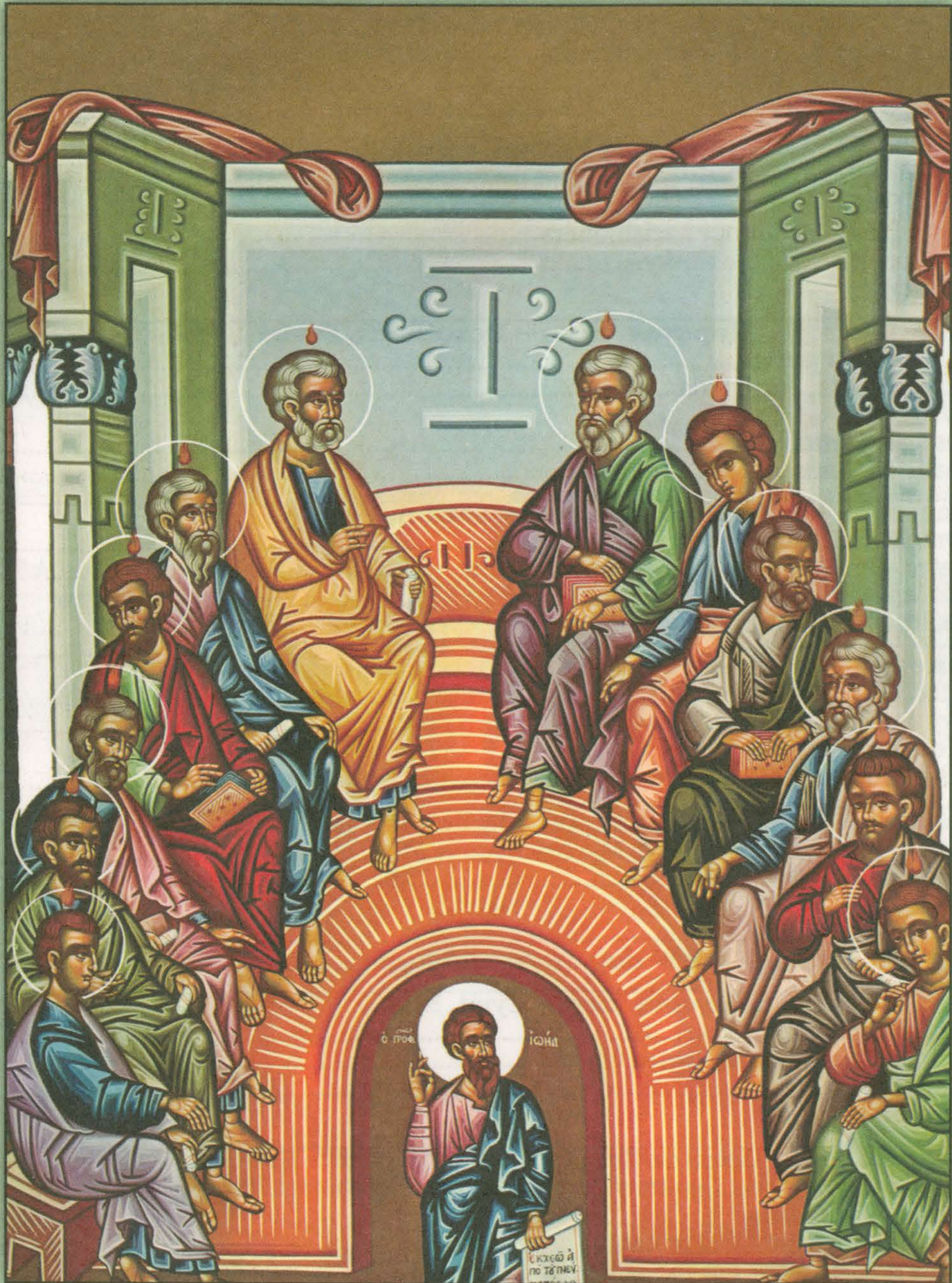
Icon of Pentecost №: 1320/2019